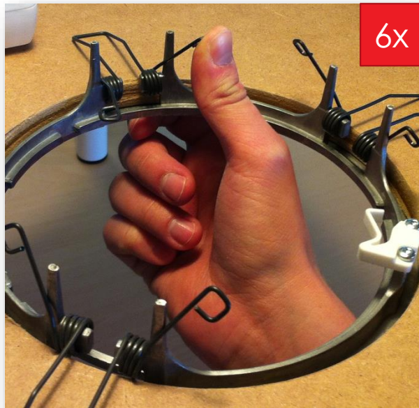
Aanzicht boven het plafond