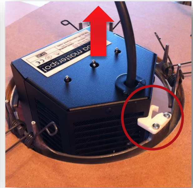
Boven aanzicht plafond