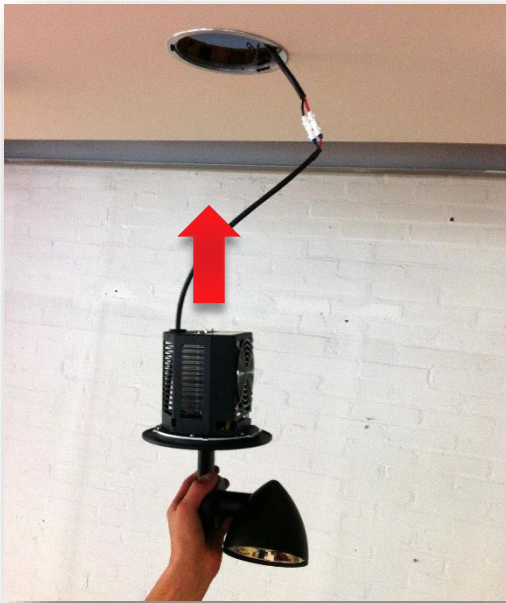
Onder aanzicht plafond