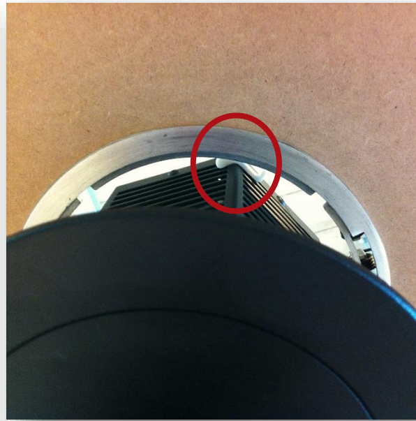
Onder aanzicht plafond